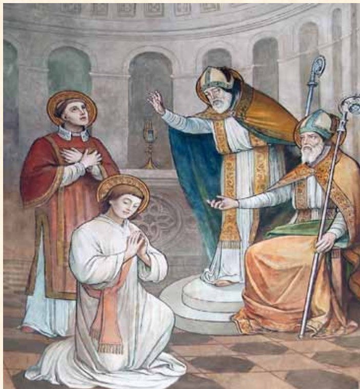
Gubbio, Cattedrale dei Santi Mariano e Giacomo, Affresco dell'abside