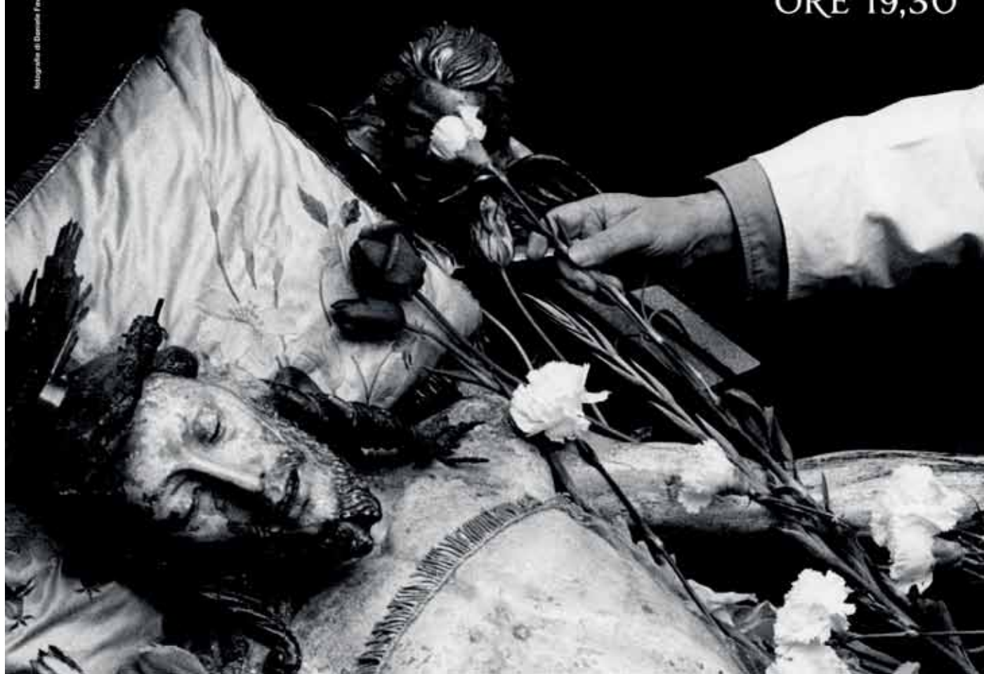
Immagine di Donato Fera Protostudio. Disegni di Carpi, Francesco F. Rappelli, Carlo Bernini.